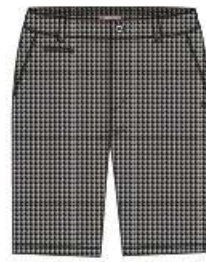
ROYAN Bermuda 56%CO 40%PA 4%EA 38 au 52