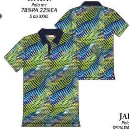
ONDE Polo mc 78%PA 22%EA S au XXXL