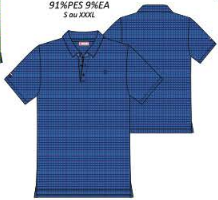
OLERON Polo mc 91%PES 9%EA S au XXXL