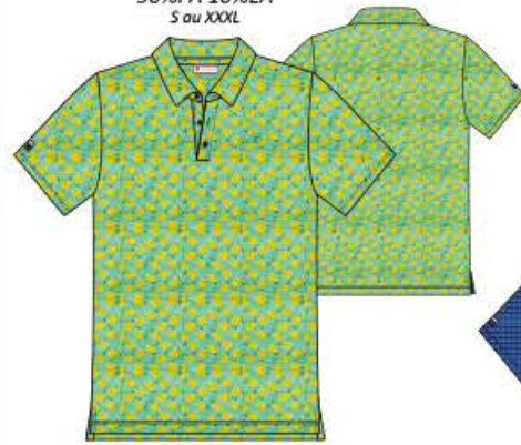
CITRON Polo mc 90%PA 10%EA S au XXXL