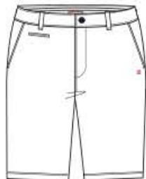
GABY Bermuda 65%CO 31%VI 4%EA 38 au 52