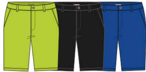
GAUTHIER Bermuda 71%PA 29%EA 38 au 52