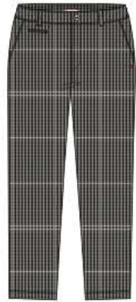
VEILLON Pantalon 56%CO 40%PA 4%EA 38 au 52