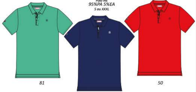
PACIFICO Polo mc 95%PA 5%EA S au XXXL