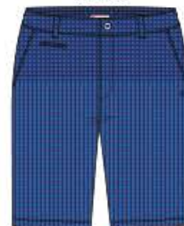
YVES Bermuda 100%PA 38 au 52