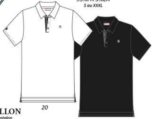
CAMMAS Polo mc 95%PA 5%EA S au XXXL