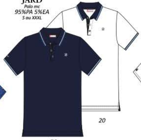
JARD Polo mc 95%PA 5%EA S au XXXL